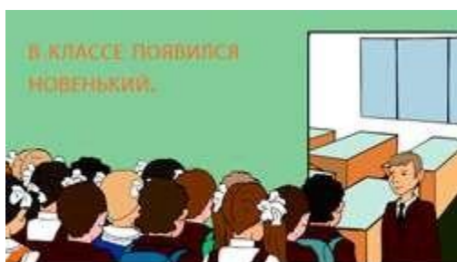
ПРОФОРИЕНТАЦИОННЫЙ ТЕСТ для школьников средних и старших классов