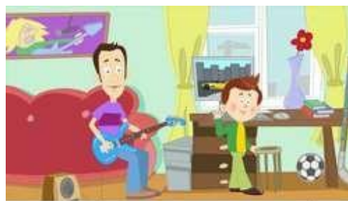
КАЛЕЙДОСКОП ПРОФЕССИЙ для школьников всех классов