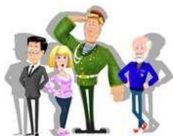
БРАТСТВО ТРУДА профорентация взрослых