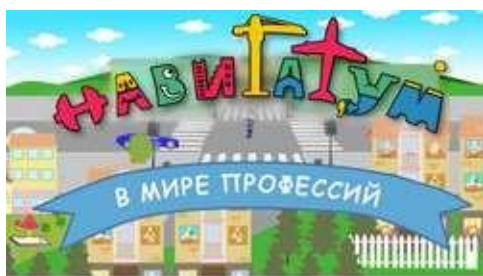
В МИРЕ ПРОФЕССИЙ мультсериал для дошкольников