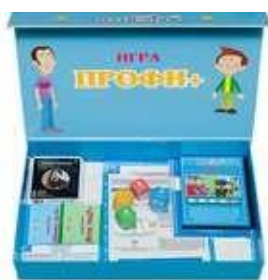
ИГРА «ПРОФИ ПЛЮС» решение для профорентации школьников