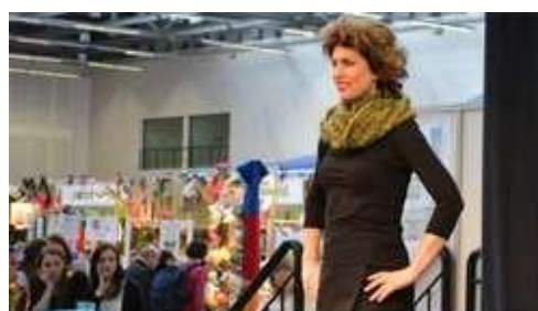
ЛАЙФХАК ПО ТРУДОУСТРОЙСТВУ фильм для соискателей