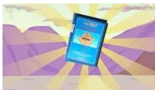
ВИДЕО ПРИТЧИ И УПРАЖНЕНИЯ психологическая поддержка и мотивация

Некоторые профорентационные мероприятия можно проводить в разной форме в зависимости от поставленной цели и возрастных особенностей учащихся.